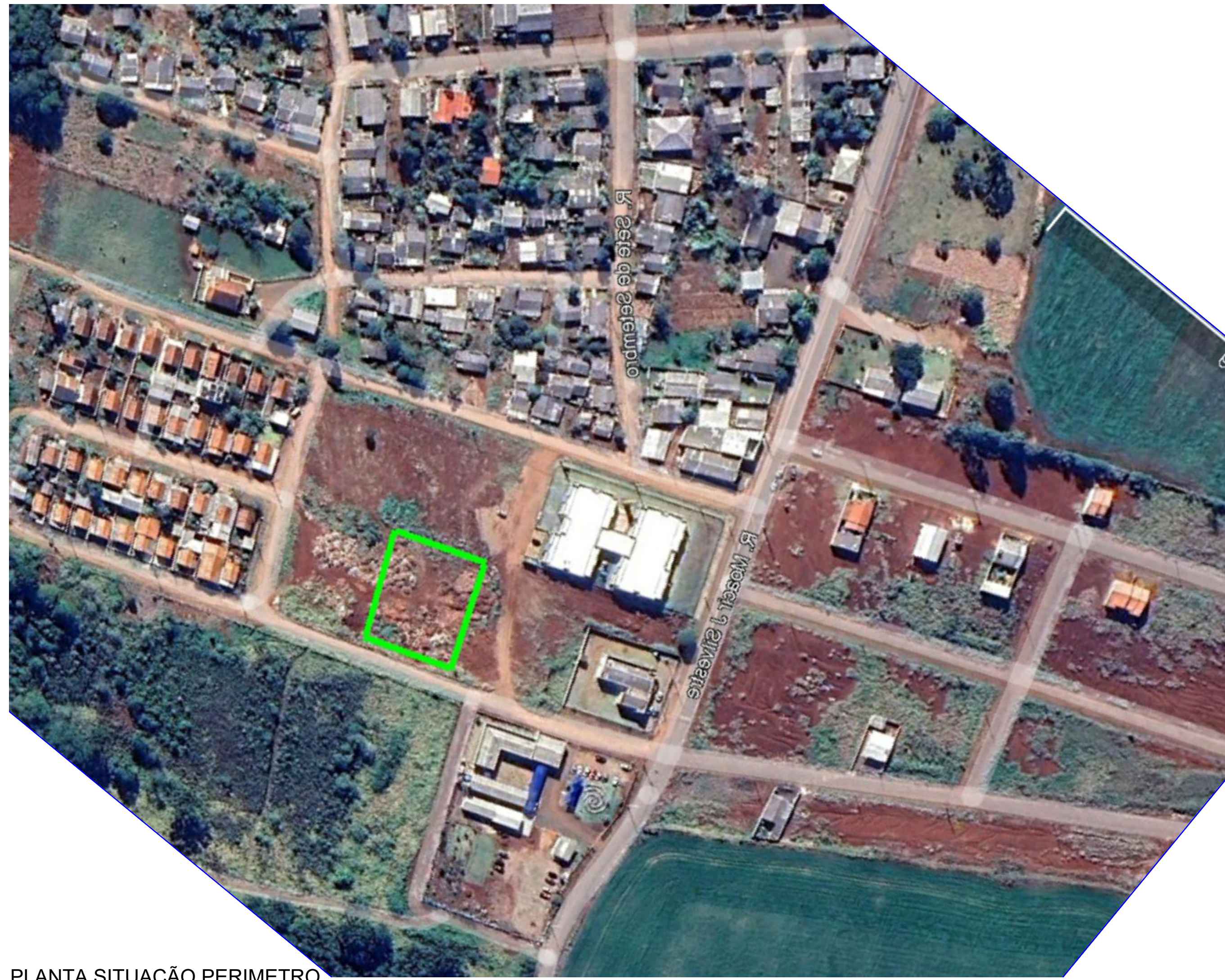
PLANTA SITUAÇÃO PERIMETRO. Escala Sem Escala.